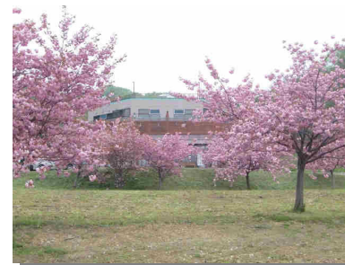
高齢者ケア研修センター 財田の杜 正面