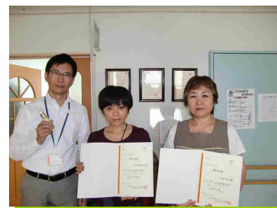
修了証書を手に記念撮影