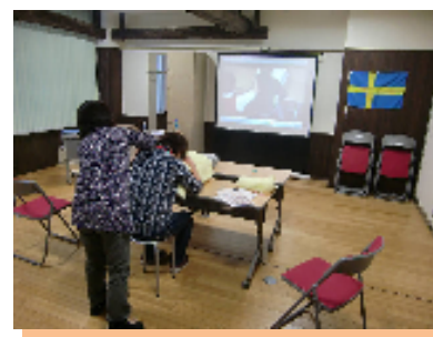
背中のタクティールケア