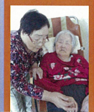
今月のベストショット 「仲良しな2人」