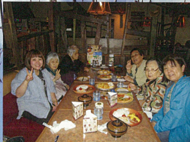
お花見の後は皆で休憩&お食事