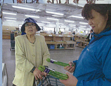
「アスパラ買って夜に食べるか」 と高岡さん