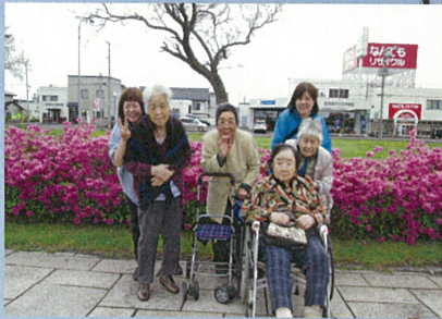
伊達市カルチャーセンターにて 記念写真