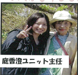
庭香澄ユニット主任