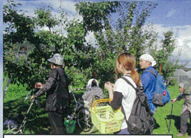
皆で果物畑を散策。一生懸命歩きました。