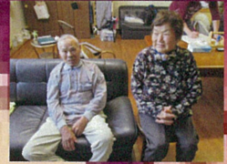
今月のベストショット 「夫婦水いらず」

ご家族の皆様いかがお過ごしでしょうか。 外の景色も段々と秋になってきましたね。それに伴い気温も低くなり体調を 壊しやすい時期になりました。ご家族の皆様も風邪には十分注意して頂けら うと思います。