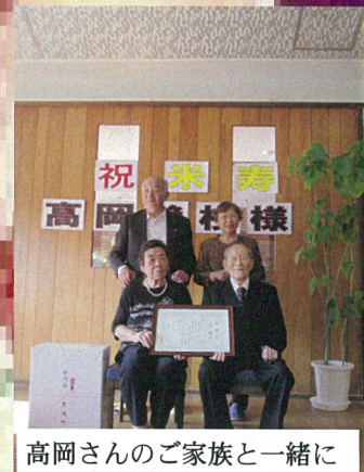
高岡さんのご家族と一緒に