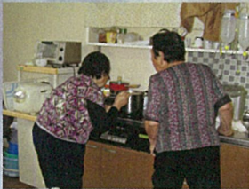
高岡さん「どうだい？ ちゃんとできてるかい？」