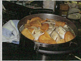
しっかり煮込んで・・・。