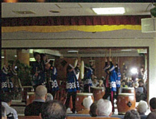
力強い太鼓の演奏です。