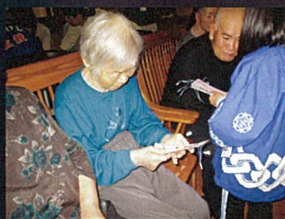
白間さんも心のこもったプレゼントをもらって嬉しそうです。