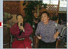
今月のベストショット 「昔から仲良し」