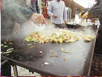
職員が一生懸命焼きました!