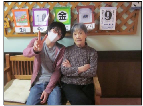
猪手ユニット主任ケアワーカーと一緒に過ごされている角さん。