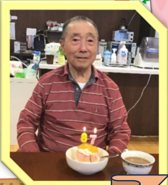
佐々木さん お誕生日おめでとう