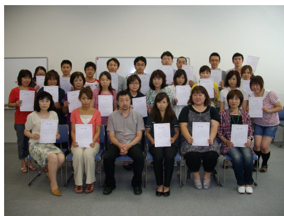
第2回認知症対応型サービス事業 管理者研修修了者