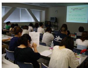
管理者研修受講風景