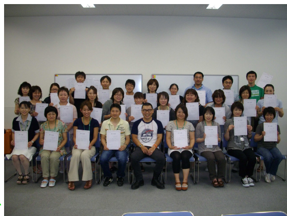
第2回認知症介護実践者研修 修了者