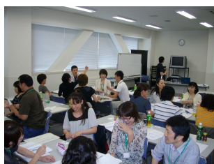
実践者研修受講風景

☆ 会場 北翔大学 北方圏学術情報センターポルト(札幌市中央区南1条西22丁目1-1)