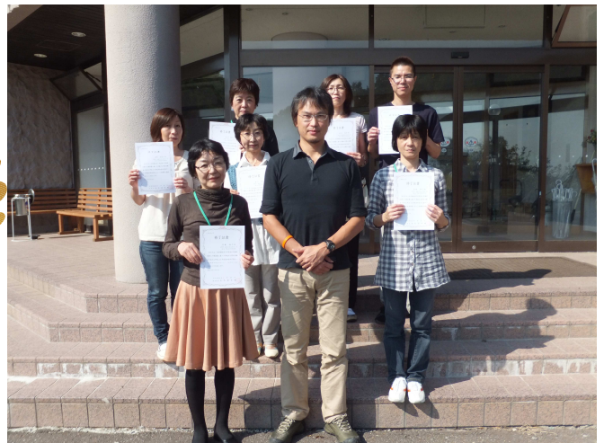
管理者研修修了者