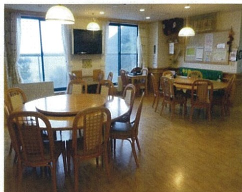
食堂兼多目的ホール