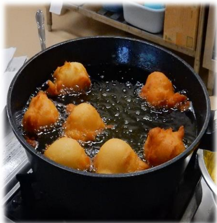
プレーン ドーナツ