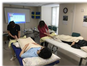
足のタクティールケア