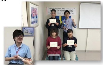
修了証書を手記念撮影