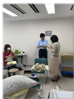
なんと地元情報誌の取材を受けました! 66