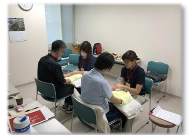
手のタクティールケア